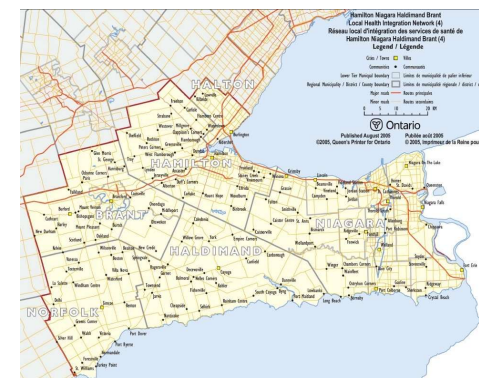
Linda Cardinal et al. « Les pratiques d'offre active de services de santé mentale en français dans la région de Hamilton Niagara Haldimand Brant en Ontario : innovation et optimisation, » Cahier de transcription, page 4.